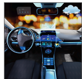
トップコラムモジュールと ヘッドアップディスプレイ