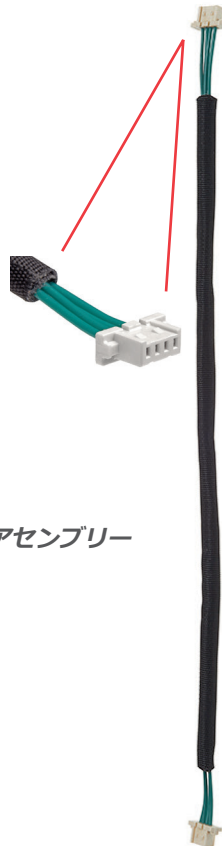
直線型ディスクリートワイヤー ケーブルアセンブリー