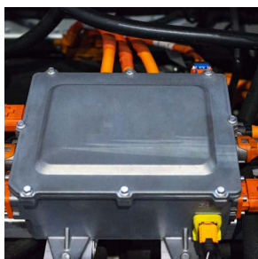
バッテリーマネジメントシステム

バッテリーマネジメントシステム (BMS) インバーターファスナコンポーネント ビークルコネクティビティ テレマティクスモジュール ヘッドアップディスプレイ